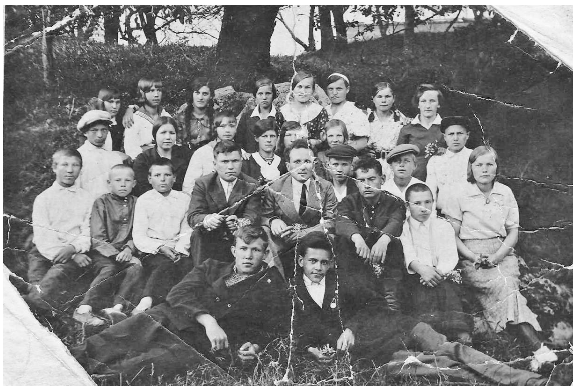
С.Вертное. Школа. 1938 год