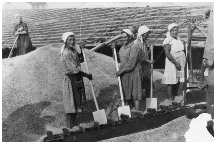
С.Вертное. На току.

Начало проекта в №73-74 от 15 сентября, №75-76 от 22 сентября.