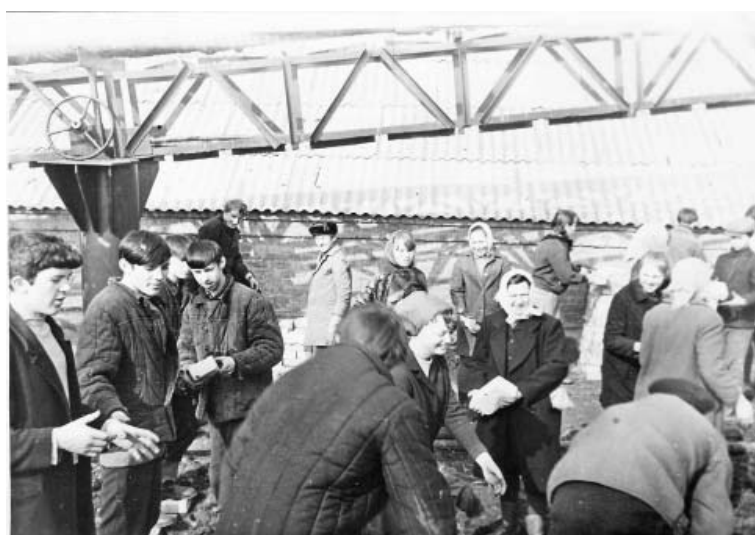
11 апреля 1970 года. Всесоюзный субботник. 9 «Б» класс.